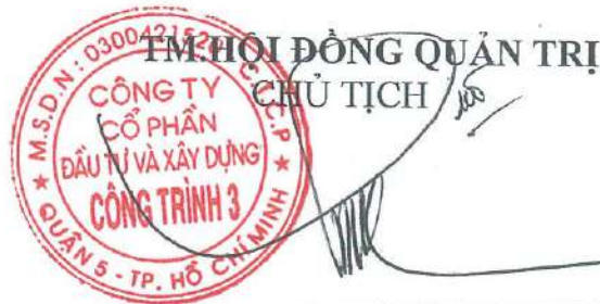
Trần Quốc Đoàn