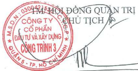
TRẦN QUỐC ĐOÀN